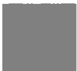
Signatura electrònica Firma electrònica

Si voleu impugnar la present resolució, que posa fi a la via administrativa, podeu interposar recurs contenciós administratiu davant el Jutjat Contenciós Administratiu de Tarragona, en el termini de dos mesos, a comptar des del dia següent de la seva notificació.