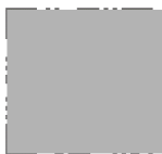
Signatura electrònica Firma electrònica

Contra aquesta resolució es pot interposar per les persones legitimades recurs contenciós administratiu davant el Jutjat Contenciós Administratiu de Tarragona, en el termini de dos mesos comptats a partir de l'endemà del dia en què s'hagi publicat en el perfil de contractant de l'Ajuntament: https://contractaciopublica.gencat.cat/ecofin_pscp/AppJava/cap.pscp?ambit=5&keyword=salou&reqCode=viewDetail&idCap=8907831 . Alternativament i de forma potestativa, es pot interposar recurs de reposició davant l'òrgan de contractació en el termini d'un mes de la seva publicació en el perfil de contractant.