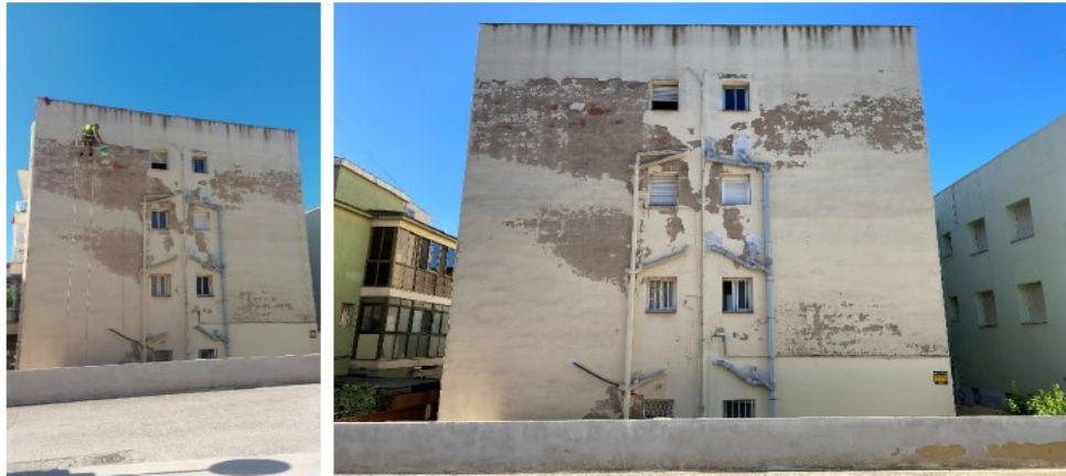
Repicat del revestiment en mal estat de la façana posterior (nord)