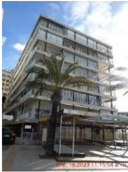
Lateral esquerre de l'edifici (vist des del frontal del c. Colom)