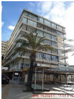
Cantonada del lateral esquerre de l'edifici (vist des del frontal del c. Colom)