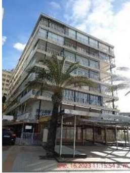
Baixos del lateral esquerre de l'edifici (vist des del frontal del c. Colom)