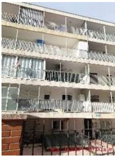
Frontal de l'edifici (vist des del c. Brussel.les)