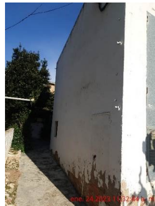
ene. 24,2023 11:32:44 a. m.