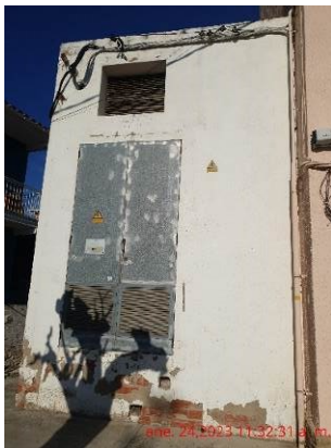
ene. 24,2023 11:32:31 a. m.