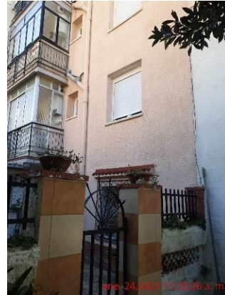
Part del darrera de l'edifici i del transformador

Tot l'exposat anteriorment es posa a la seva disposició per tal que produeixi els efectes oportuns."