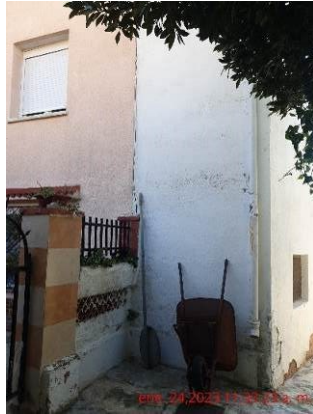
Part del darrera de l'edifici i del transformador