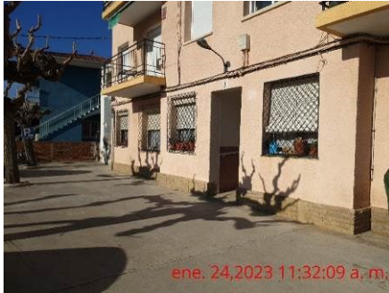
ene. 24,2023 11:32:09 a. m. Entrada a l'Ed. D del c. Cambrils, núm. 28

S'adjunten fotografies de l'estat de conservació i de la situació d'aquesta unitat transformadora elèctrica en el moment de la inspecció: