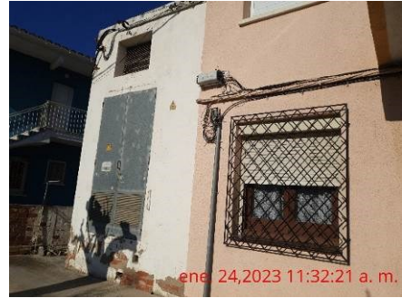
ene. 24,2023 11:32:21 a. m. Transformador elèctric adossat a l'edifici